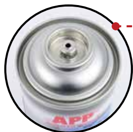
Düsenanschluss - weiblich

APP Pre-Fill Gas Converter Spray ist mit einer neuen schwenkbaren Breitstrahldüse ausgerüstet, deren Aufbau den Strahl ähnlich wie in einer Lackier-Spritzpistole gestaltet.