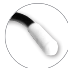
Protection des arêtes vives