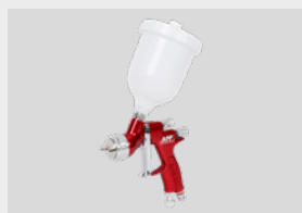
Devilbiss GTI Pro Lite