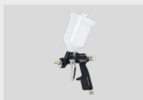
NTools FX1 mini