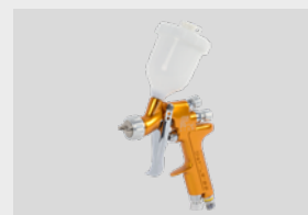
SRI Pro Lite