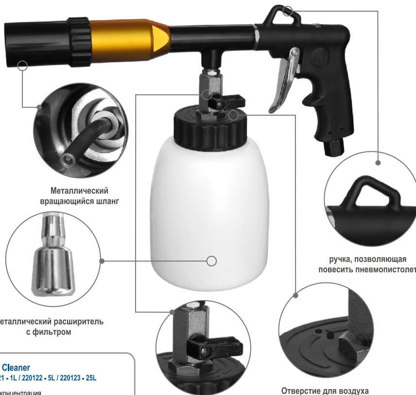
Металлический вращающийся шланг