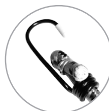
Крюк, изготовленный из высококачественной закаленной стали